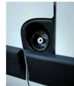
Nella pagina a fianco, i due veicoli in prova al Parco del Valentino e, qui in basso, durante il test in città. Sopra, il Nuovo Daily CNG mentre effettua il rifornimento di metano alla stazione di Corso Botticelli. Nei particolari qui sopra, il bocchettone per il metano che si trova sul fianco sinistro, alla base della portiera; di fianco, l'alloggiamento di una delle bombole ben protetta dagli urti laterali