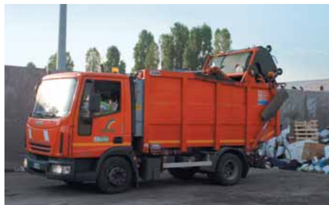
Qui sopra, un Daily con un compattatore per la raccolta dell'umido e del secco; sotto, un Eurocargo sempre allestito con compattatore. Nella pagina a fianco, in alto, un Eurocargo motospazzatrice per la pulizia delle strade e, in basso, un Nuovo Daily con il cassone per la raccolta di vetro e lattine